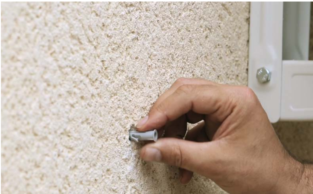
3 – Mettez en place les 4 chevilles