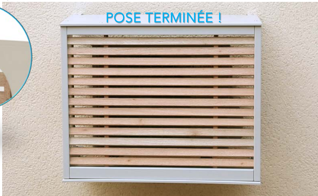
Nota: Modèle présenté avec option sous-face