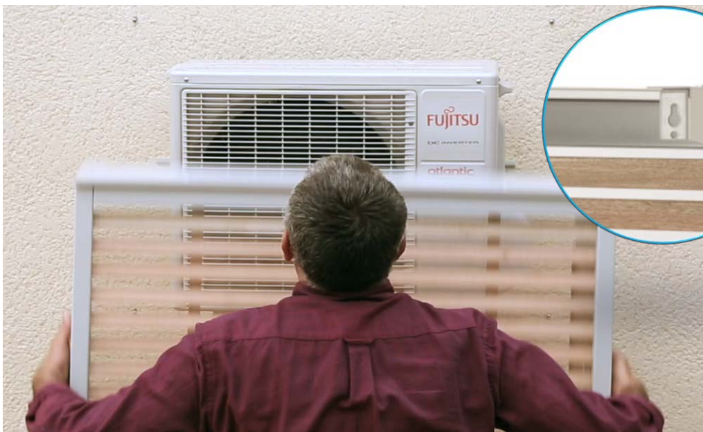
5 – Suspendez votre cache climatisation par les 4 trous à boutonnière, grâce aux vis mises en place sur la paroi