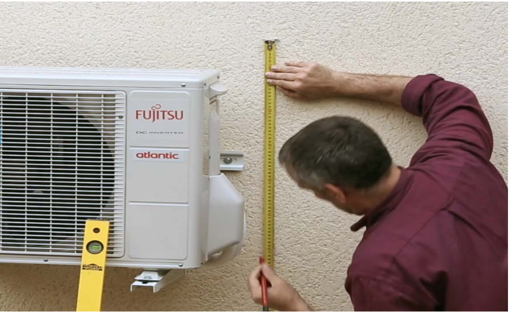
1 – Tracez les repères horizontaux et verticaux en suivant les dimensions ci-dessus