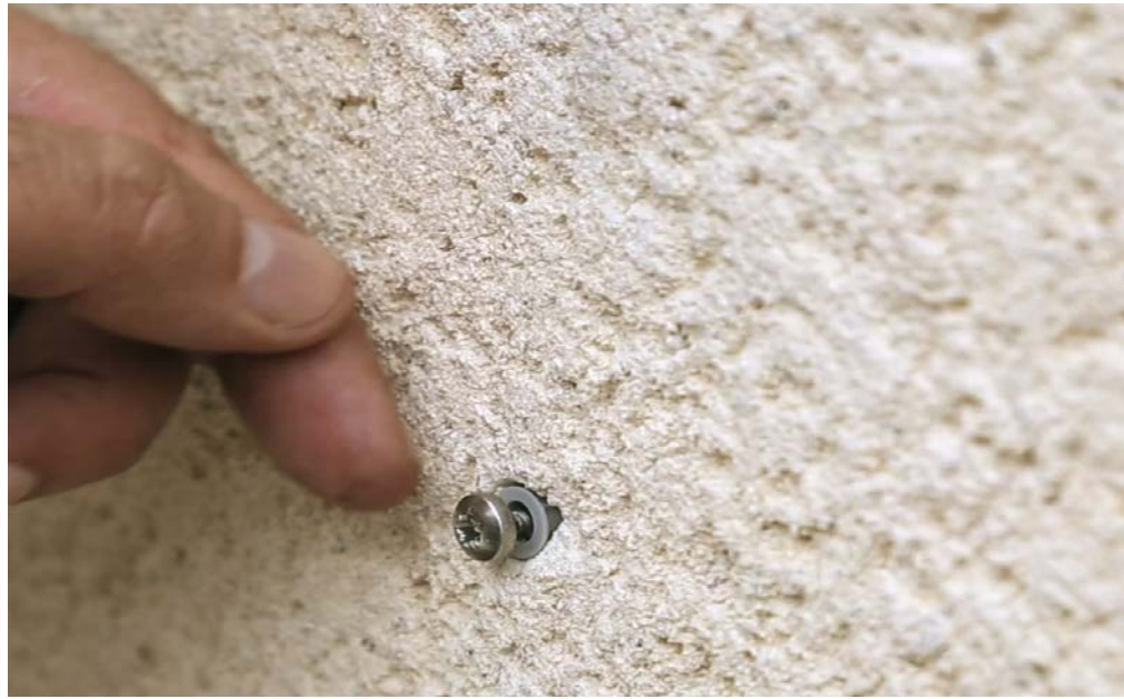
4 – Mettez en place les 4 vis 4.8 x 50, en les laissant dépasser de 5 mm de la paroi