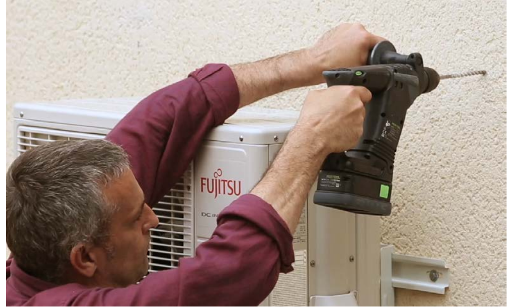
2 – Percez les 4 trous avec une mèche à béton Ø 7.5 ou 8.0