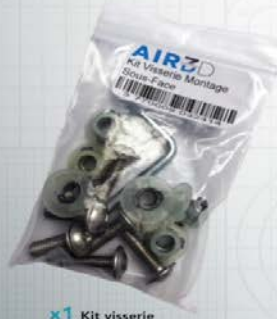
x1 Kit visserie