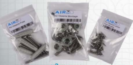
x3 Kit visseries