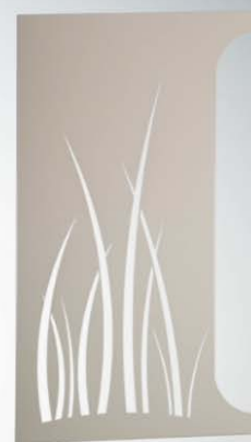
x1 Côté droit laqué