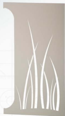
x1 Côté gauche laqué