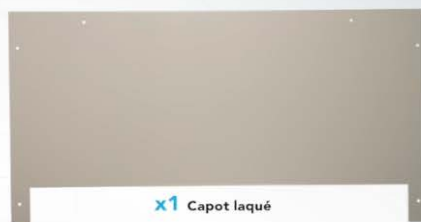
x1 Capot laqué